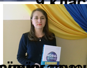
Найкраща Сервіс-Мислителька традиційно-розвиненої, інформаційно-свідомої особистості, здатної до