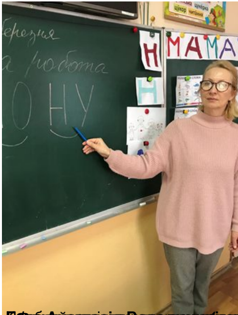
Робота в групі з вивчення теми «ОНУ» в умовах доброзичливого ставлення один до одного