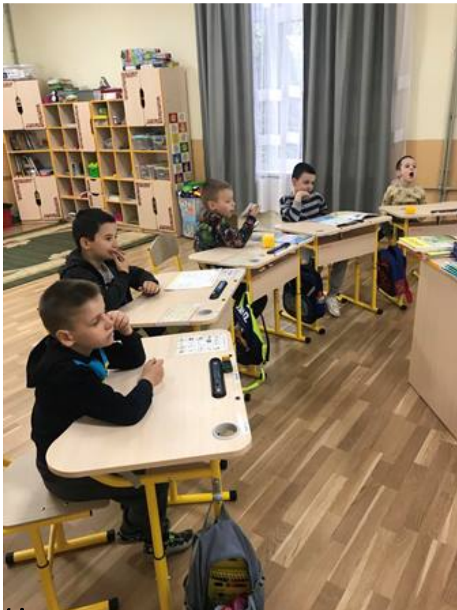
4 А клас