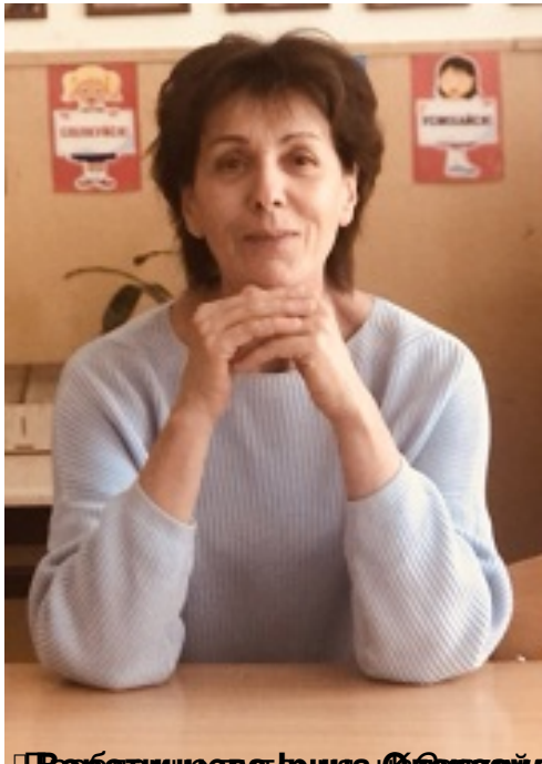
Проблемне завдання «Безпечний шлях» – кіп до виховання учнів, підготовка їх до життя і праці»