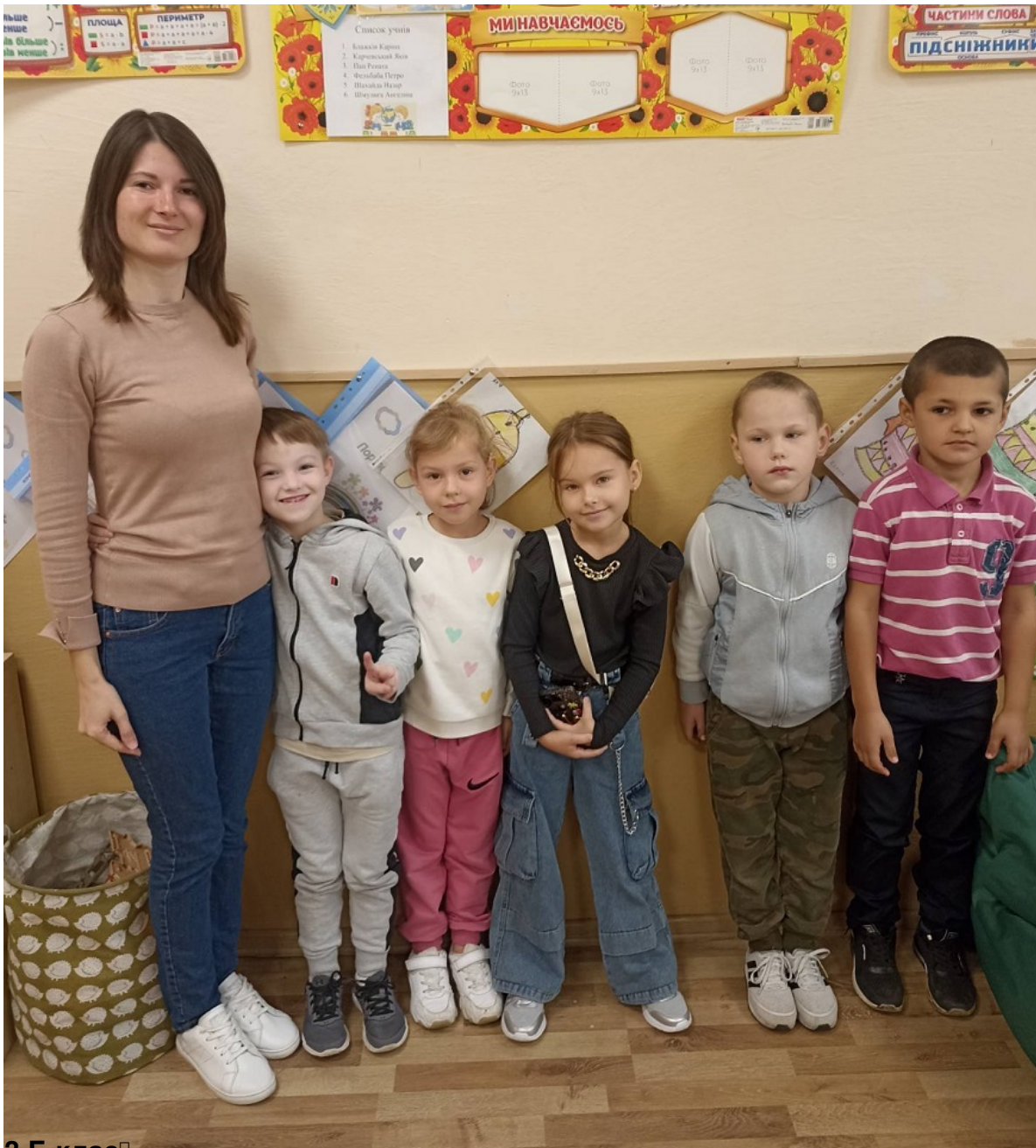
3 Б клас