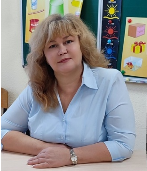
Робота з учнями на тему "Милосердя в сучасних умовах"