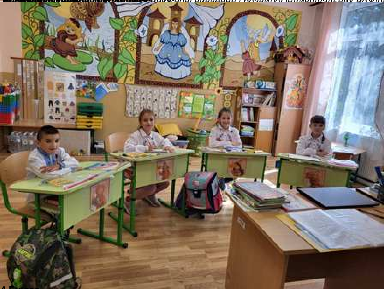
4 Б клас

Важливою метою педагогічної діяльності є вивчення і розвитку індивідуальних можливостей учнів