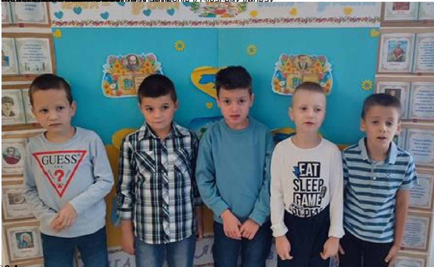
3 А клас