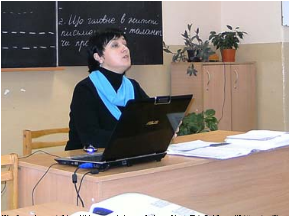
Наборів і конкурсів серед вчителів укр мови і літ у Київській області, організований МО вчителів укр мови і літ