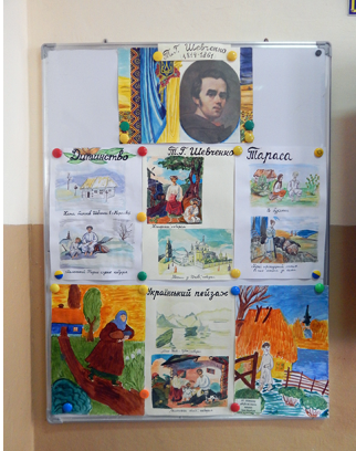
2016-2020 національний рік формативний вплив Шевченкових творів на розвиток творчості