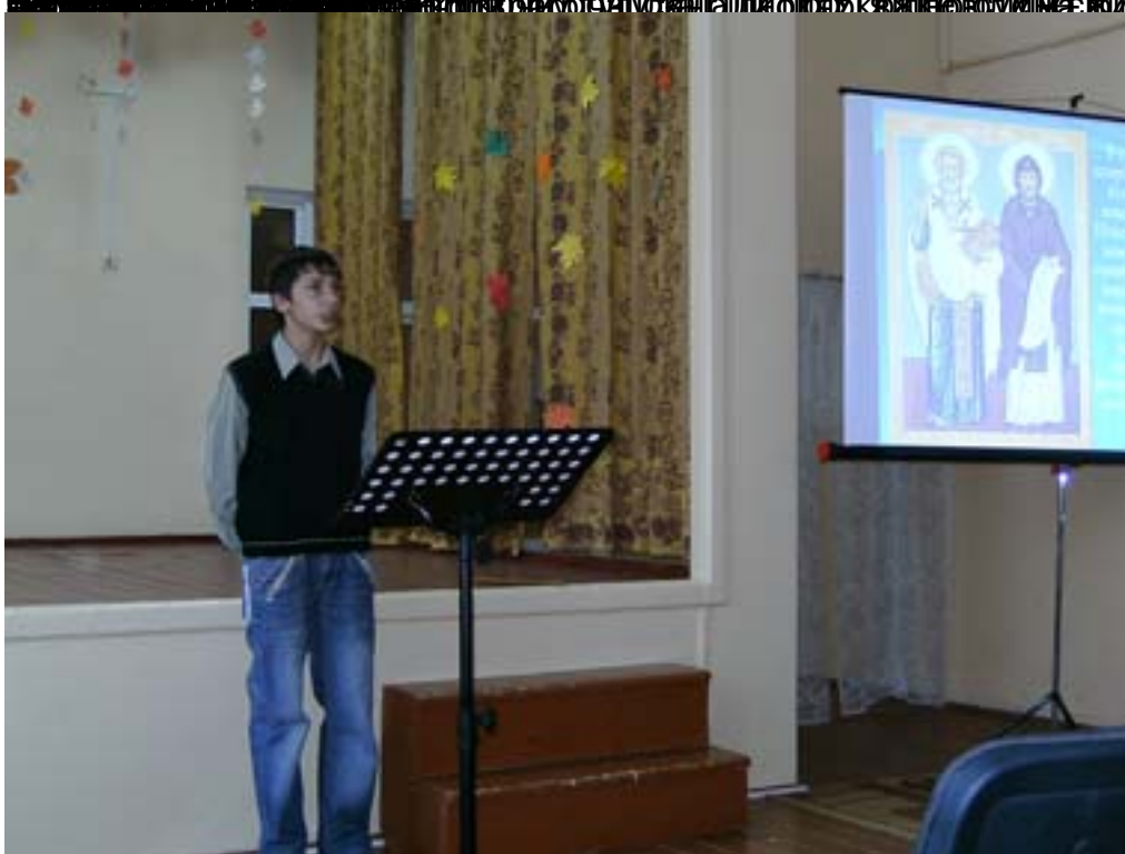
Вітання вчителів української мови і літератури з нагоди 100-ліття незалежності України та 100-ліття Української держави