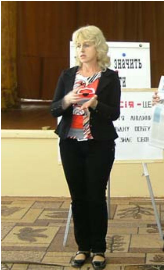
Уч. 10 кл. під час виступу на конкурсній програмі «Від історії до сучасності» на тему: «Ні» Які слова не можна сказати українцям».