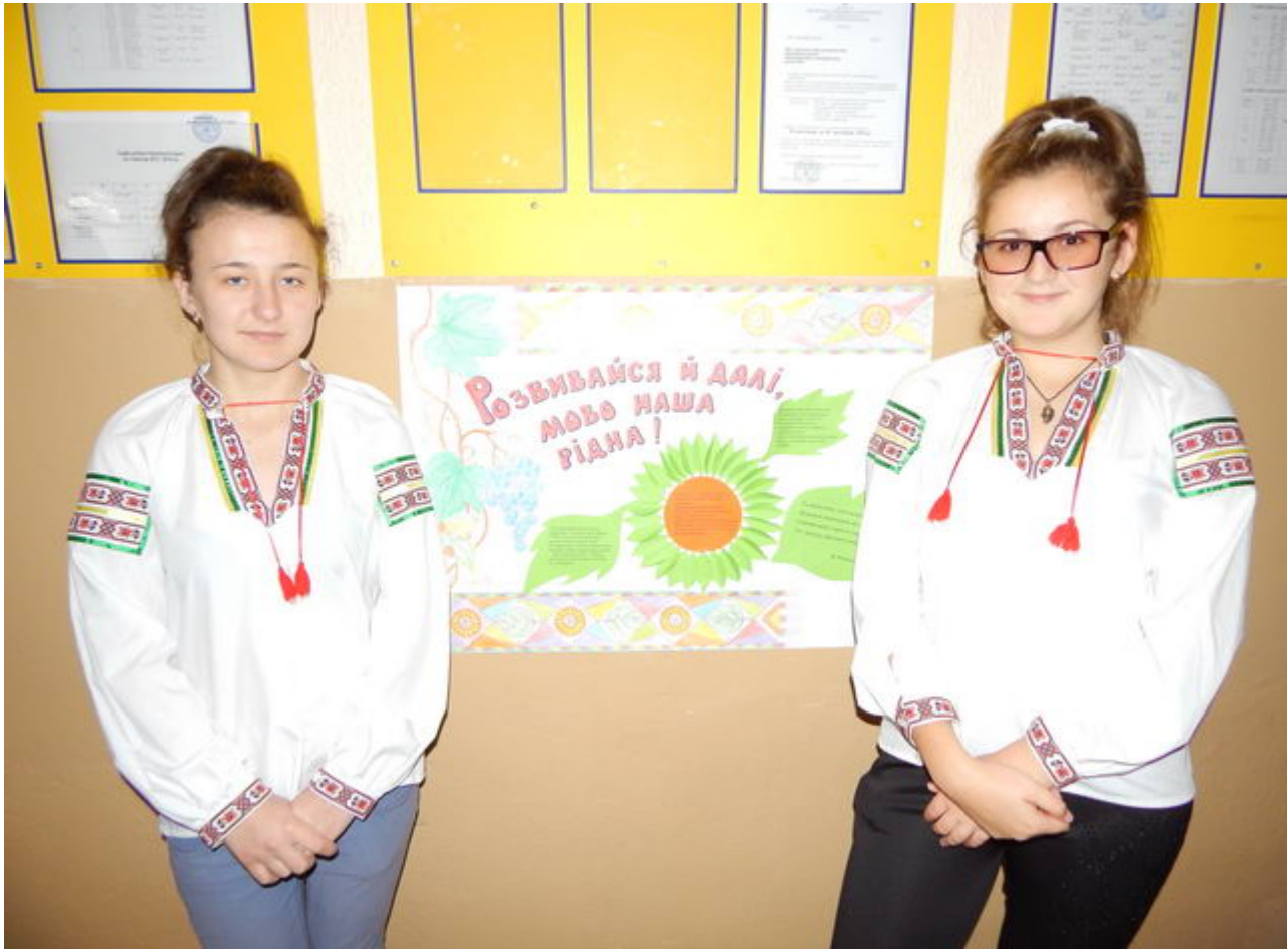
9 Дітями до 2018 року з ініціативи Будівельної Колегії Дітей Кривого Рогу було організовано конкурс «Лавні промі