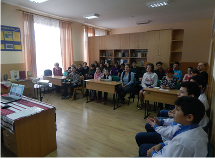
кураторів та вчителів з акцією «Закарпаття» шкільний захід до