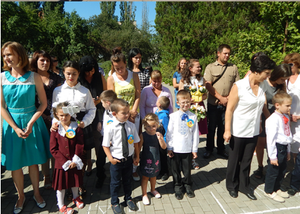
Ваткова Дішка «Добрий день, Країно Знань»