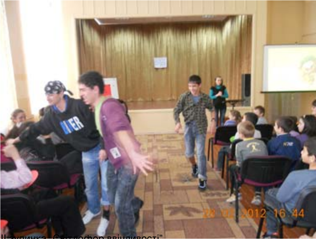
Шукачка «Світлофор ввідливості»