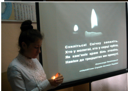
Усний журнал до Дня пам'яті жертв голодоморів «Україна пам'ятає!»