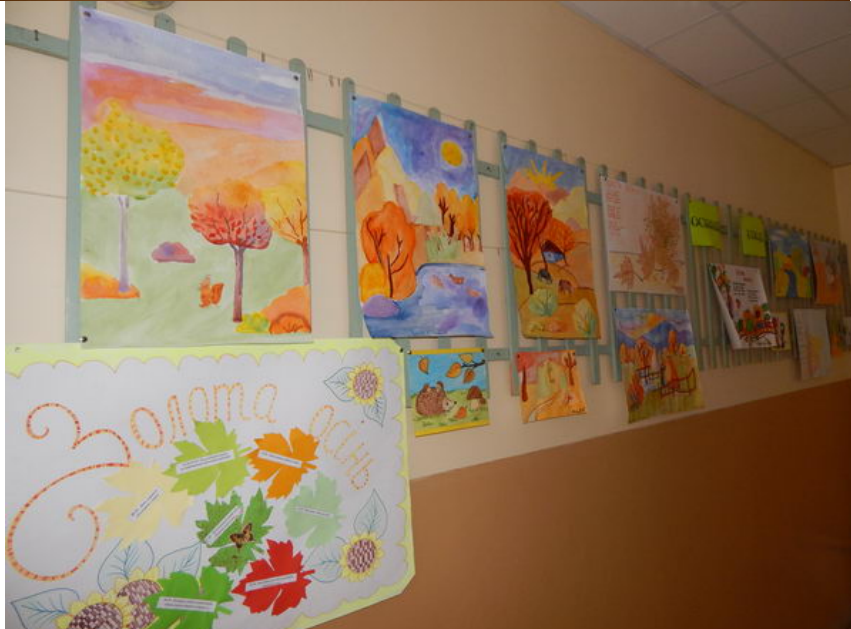
Міжкласний фестиваль "Повітряний листопад" 9 грудня. У школі-інтернаті кожного