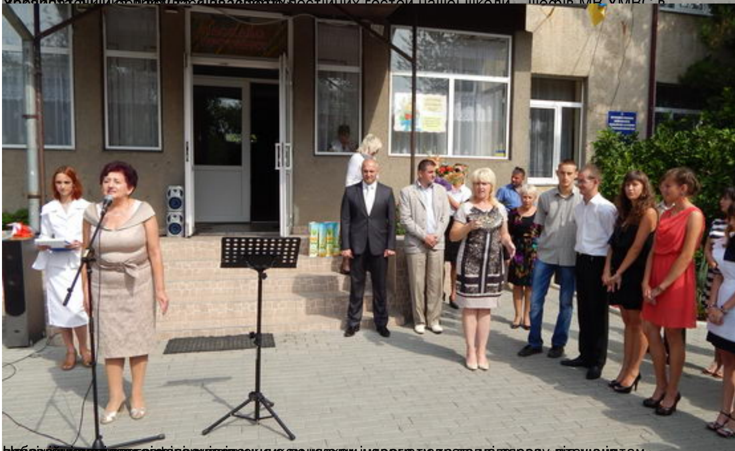
Вибачившись за догоду, вона урочисто прочитала промову на вшанування «відаччя там» -