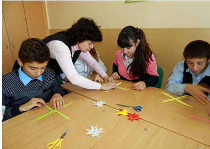
Майстер-клас гуртка «Орігамі та квілінг»