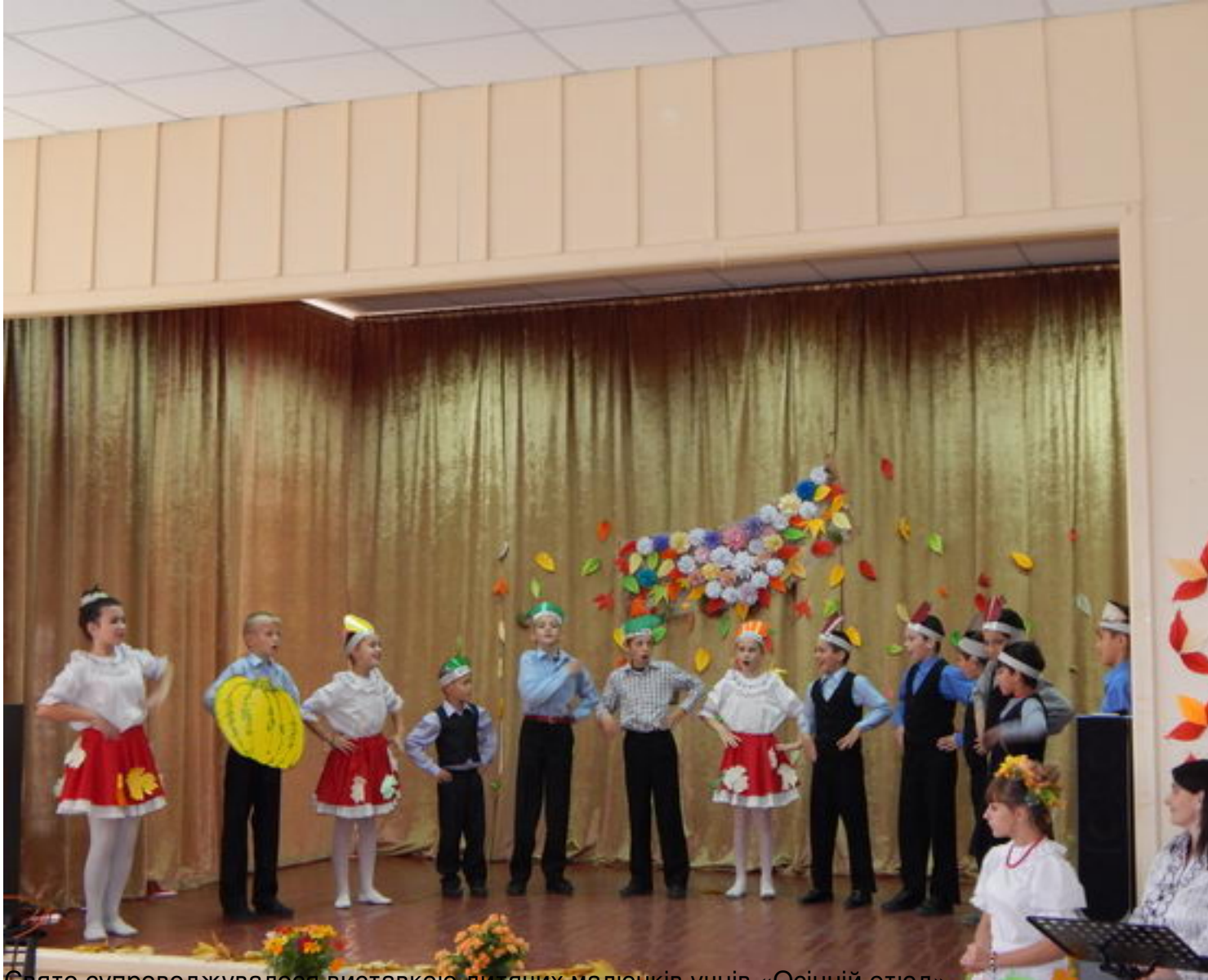
Свято супроводжувалося виставкою дитячих малюнків учнів «Осінній етюд».