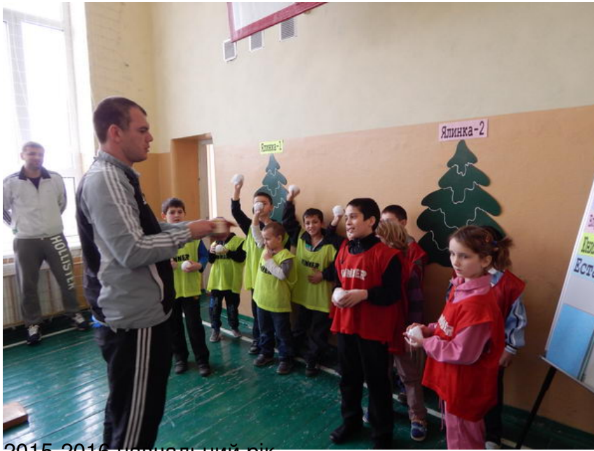
2015-2016 навчальний рік